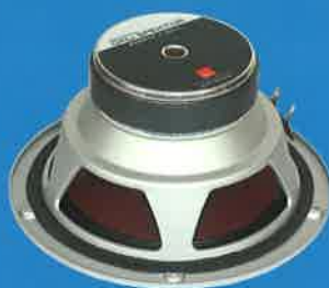
Una torre per tutti DALI Spektor 6