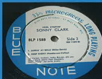
Pane e musica per audiofili BLUE NOTE