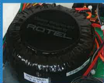
Campione dei medi ROTEL A14